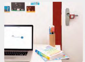
Design e Tecnologia